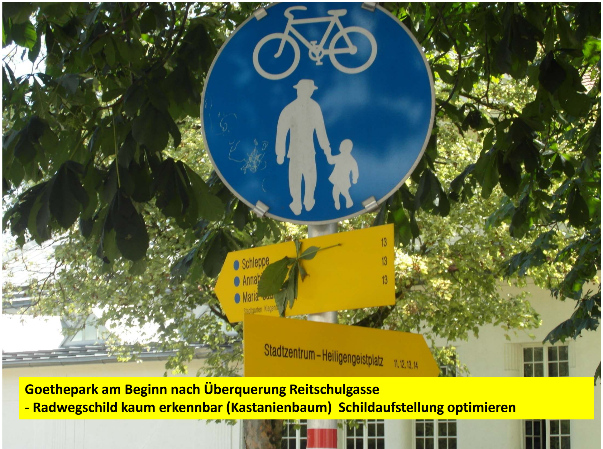
Goethepark am Beginn nach Überquerung Reitschulgasse - Radwegschild kaum erkennbar (Kastanienbaum) Schildaufstellung optimieren