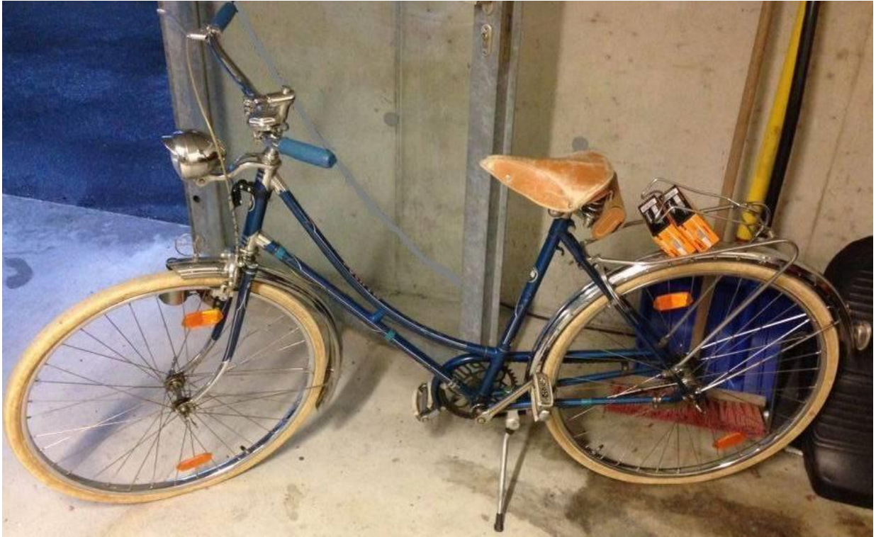
"Ein paar Bilder von meinem Püchle". Ein schönes S50 mit Daimler-Kotflügelabzeichen, 1950er-Jahre