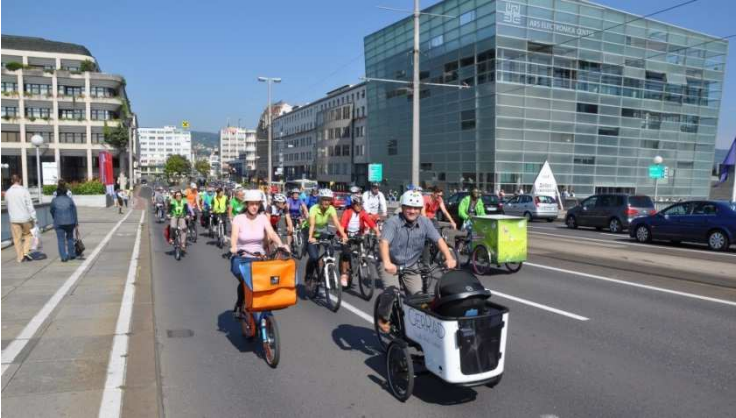
Eindrücke von der Linzer Rad-Parade

Aktuelle Informationen wie Treffpunkte der Sternradfahrt und das Programm der Rad-Parade sind auf www.radlobby.at/sternradln zu finden.