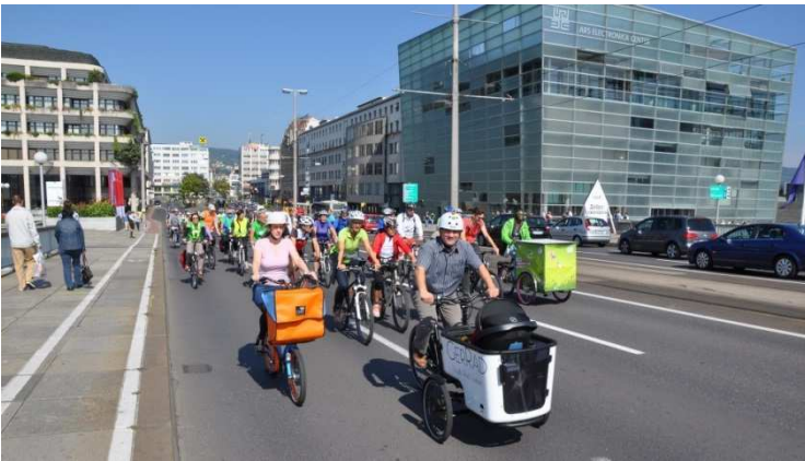
Eindrücke von der Linzer Rad-Parade

Aktuelle Informationen wie Treffpunkte der Sternradfahrt und das Programm der Rad-Parade sind auf www.radlobby.at/sternradln zu finden.