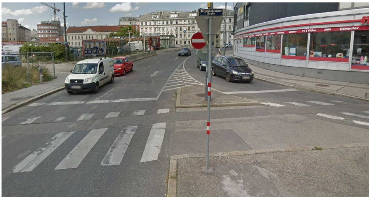
Nicht geöffneter Kreuzungsbereich Schönbrunnerstraße mit Blickrichtung auf den Wientalradweg

Diese Führung ist aufgrund des hohen MIV-Aufkommens unattraktiv und zudem gefährlich. Daher Kreuzungsbereich Schönbrunnerstraße soll daher für Radfahrende geöffnet werden.