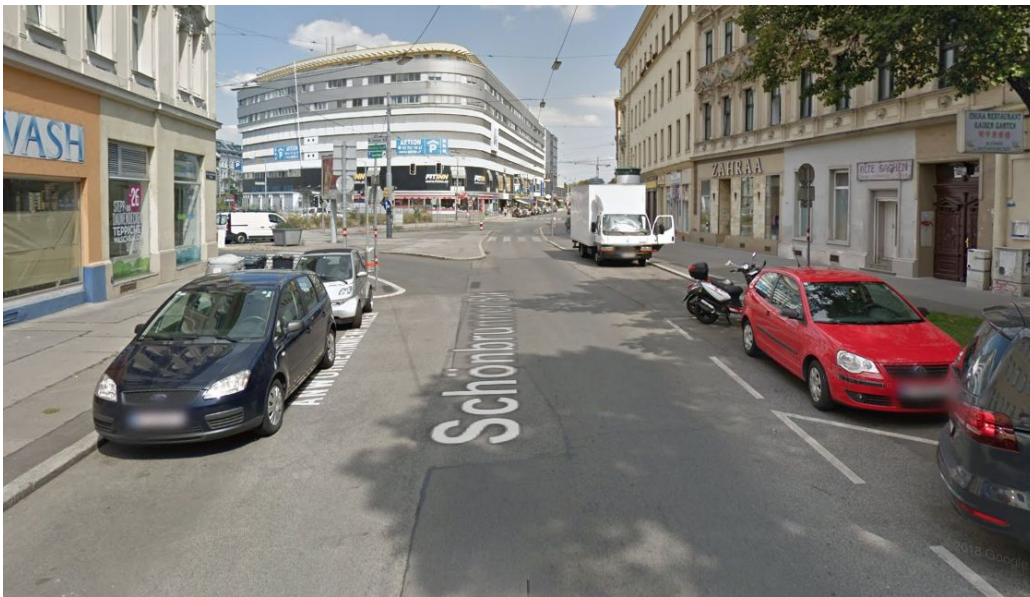
Blick Richtung auf das U4 Center über die Schönbrunnerstraße. Links der Kreuzung entsteht das Vio Plaza.

Die Schönbrunnerstraße von Hausnummer 291 bis 173 ist für alle Verkehrsteilnehmenden aktuell nur in eine Richtung befahrbar. Für Radfahrende rund um das Grätzl Tivoliviertel wäre es von großem Vorteil diese auch in Richtung Vio Plaza befahrbar zu machen, um direkten Zugang zum Einkaufszentrum zu schaffen und gleichzeitig auch diesen geschäftigen Teil im Sinne der Wirtschaftstreibenden weiters zu attraktivieren.