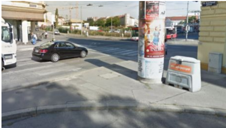
Blick Richtung Ruckergasse und Schönbrunnerstraße von Hufelandgasse aus. Die derzeitige Bebauung erlaubt kein Kreuzen mit dem Fahrrad.

Diese Achse verbindet das Meidlinger Platzl bzw. die Meidlinger Hauptstraße mit dem Vio Plaza unter verkehrsberuhigten und begrünten Bedingungen.