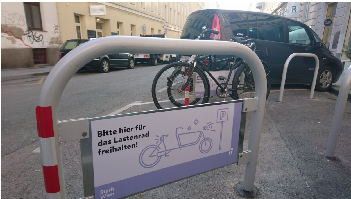
Schräg platzierte Radbügel um Lastenräder auch parken zu können

Idealerweise sollten die Radbügel so gerichtet sein, dass auch Lastenräder geparkt werden können, wie am Beispiel der Otto-Bauer-Gasse in Mariahilf.