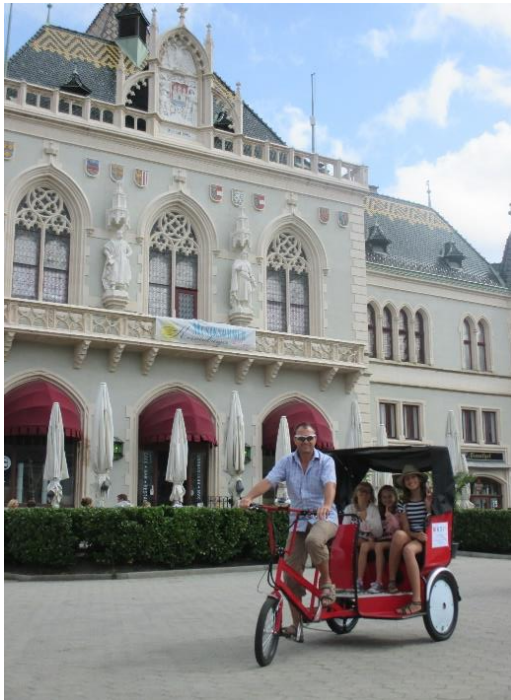
Erste Probefahrt mit der neuen Rikscha